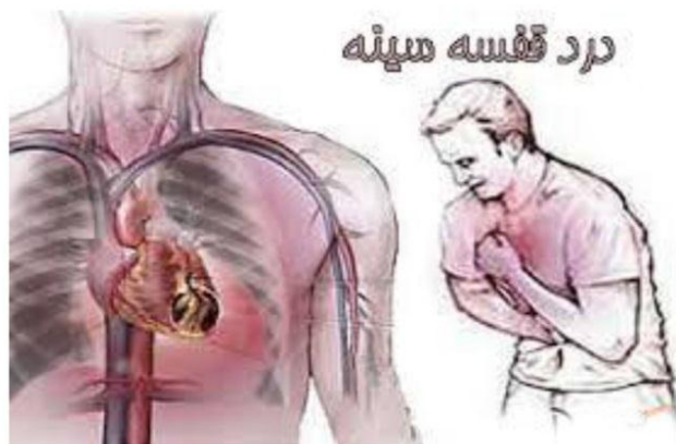
درد قفسه سینه